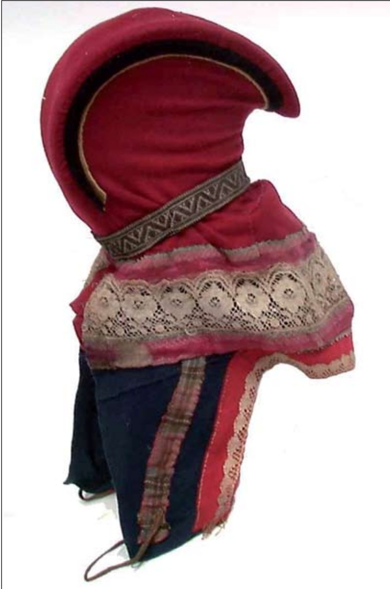
Govva 5: Ládjogahpir mii gullá Buolbmátjávraí Ohcejogas. Lea čohkkejuvvon 1907:s. Dan gahpermálles lea gállogáidá. Muđui leat bealljebilttut alit láddis ja muodobiras rukses láddis. Gahpir gávdno Norgga álbmotmuseas, NFSA.0757.