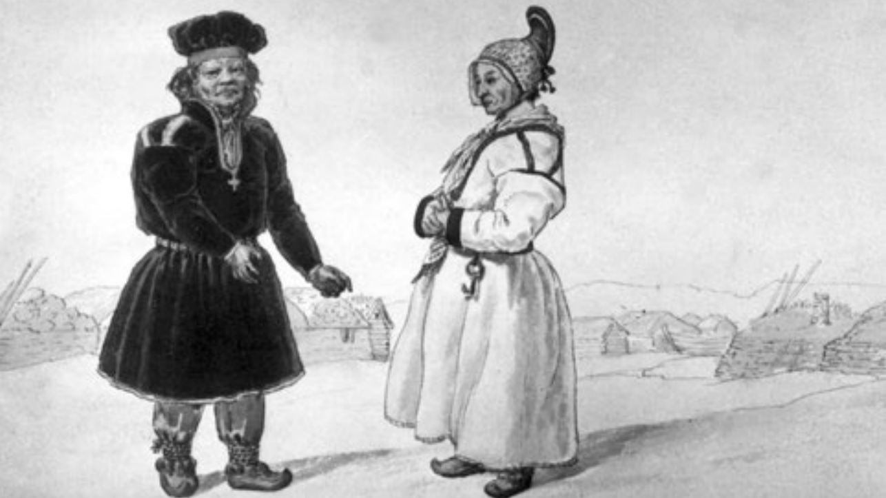
Govva 7: Flintoe čáhcenjuohtan. Dás soaitá leat Flintoe geavahan Keilhaua gova skovvin. Muhto Flintoe govvas leat olbmot Deanuvuonas eret (Sofinn fra Tanafjord). Govva lea luoikkahuvvon Norgga álbmotmuseas (NF.05134-003).

searvvai mátkái 1839:s ja jođii de sihke Finnmárkkus ja máttás Ruttii go máhce Fránskii. Govas leat ollu motiivvat mat leat seammaláganat go litografija mii lea 9. govvas. Muđui oaidnit beatnaga ja gore mat soitet leat ovdagovat/motiivvat vižžojuvvon eará sárgosiin. Sihke Mayer ja Lauvergne govveba nissonolbmuid ládjogahpiriiguin. Mayer govve gahpiriid nu ahte vuolit oassi lea sihke bumbolliinnis ja láddis. Goappašagat govveba dan gahpira mii lea moatti oasis. Lea fuomášan veara ahte dás maid govveba gahpiriid hámiid ja hearvvaide iešguđetláganin seamma govvas. Veadjá leat nu ahte dáiddárguovttos leaba áican gahpiriid leat hervejuvvon hui individuálalaččat, ja dan de čájeheaba govain. Vaikko velá eai soaitte doallat deaivása ahte gahpirat duođai ledje justa diekkárláganat go soai govveba, de dulkon dás sudno áicama duohtan dan muddui ahte leat leamaš mánggalágan hervenvuogit. Muđui ii sáhte gal váldit ollásit duohtan sudno govaid, go soai leaba hálidan govvet «dan eará», muhtumin sotnabeaibiktasiin, ja nuppe vuoru fas ideála dilis das maid leaba vásihan mátkkis. Go velá váldá vuhtii mii dan áiggi govvadáidaga ideála lei, de ii sáhte geahččat daid govaid ge mu mielas duođastussan báikkálaš hámis.