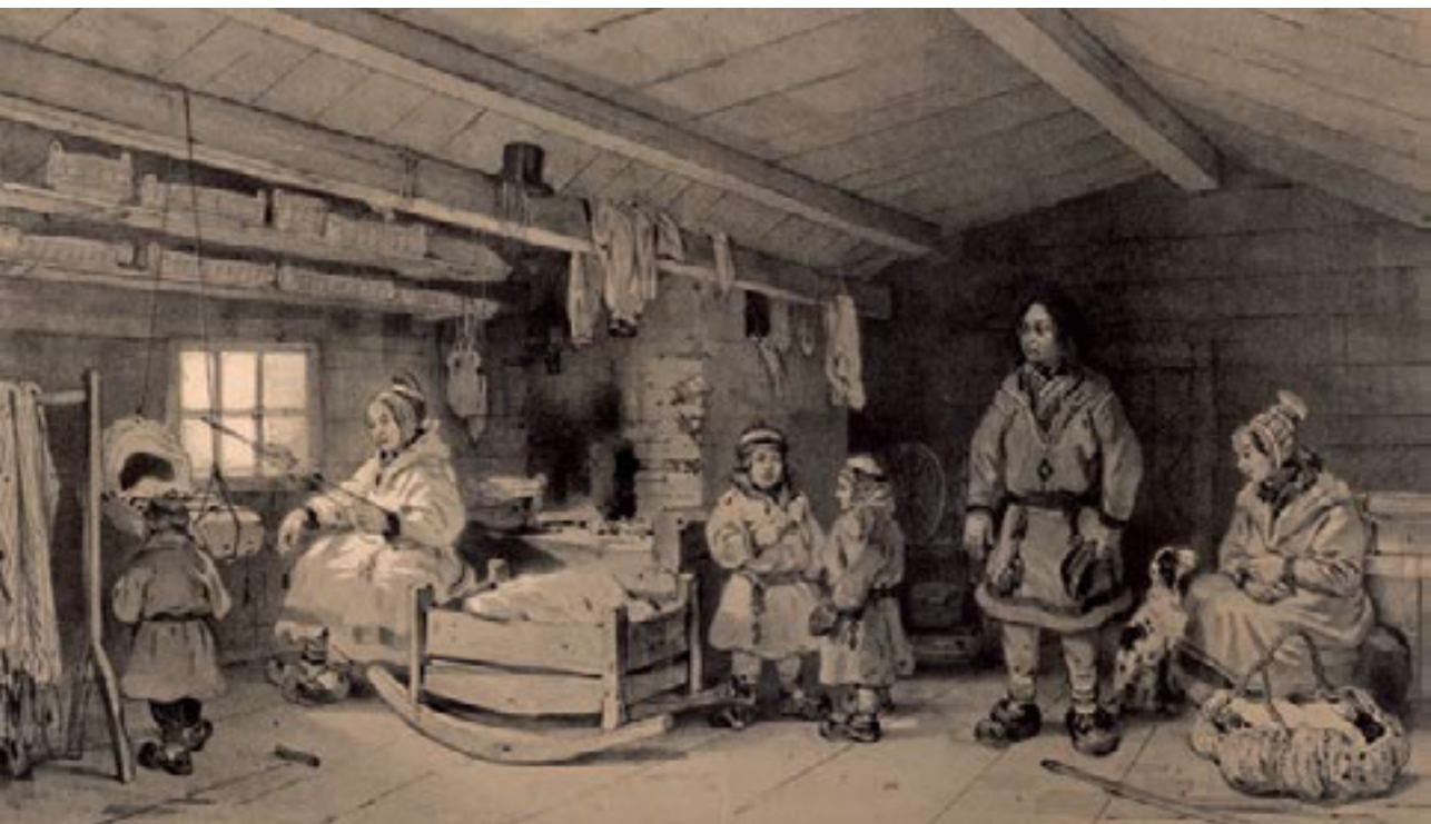
Govva 10: Berthélemy Lauvergne litografija mas oaidnit dálloeallima Guovdageainnus (Knutsen – Posti 2002: 203).