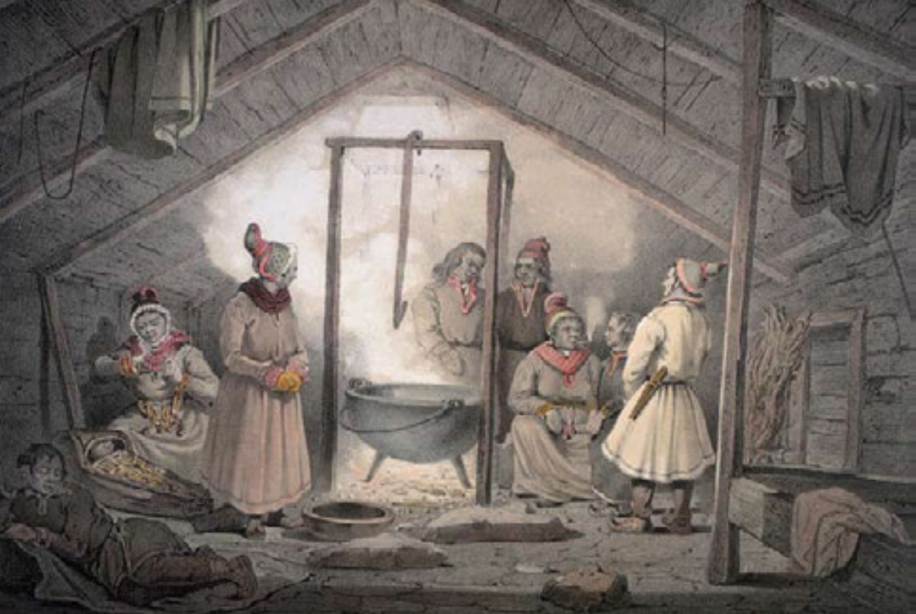
Govva 9: Mayera litografija sápmelaš dálus Sievjjus. Govva lea luoikkahuvvon Finnmárkku fylkkagirjerádjosis (Finnmark fylkesbibliotek) Čáhcesullos.