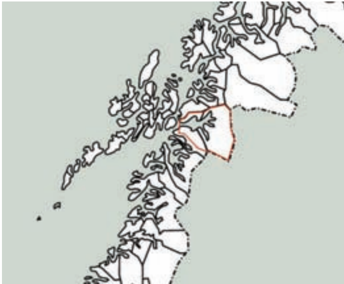
Káarta 2: ufuohdá báhpasuohkana (Ofodens præstegield) rájit. (Káartavuodu lea dahkan Anja Kaunisaja Oulu universitehtas.)

Ufuohdá báhpasuohkana (sullii) rájit leat merkejuvvon ruoksadin vulobeale kárttas (káarta 2).