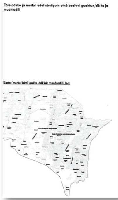
Govus 1. Ovdamearkan guođohanbeaivegirjji siiddut, mat čájehit indikáhtoriid gurut bealde ja olges bealde rabas saji masa ieža sáhtte čállit diliid birra.

Ovdal go beaivegirječállima čađaheimme välljejuvvon siiddaiguin, čađaheimmet golbma mánu guođohanbeaivegirječállingeahččaleami, man ulbmil lei iskat ja buoridit reaiddu. Maiddá dutkamusa čađaheamis iskkaima maŋŋil juohke dálvvi beaivegirjji buriid beliid ja váilevašvuodaid ovttas oasseváldiiguin, ja dutkit de sin ávžžuhusaid vuodul divuiga beaivegirjemálla. Ná ledje oasseváldit mielde buorideame reaiddu ja nu orro dovdamme luohitevašvuoda reidui ja doibmii.